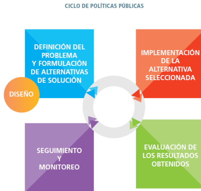
Ilustración 1: El ciclo de las políticas públicas.

La etapa de diseño considera la definición de los objetivos y líneas de acción, entendidas estas últimas como la formulación de sus acciones, prestaciones, instrumentos y mecanismos y procesos de funcionamiento. También puede considerar la definición de las metas e indicadores de proceso y resultado (IPPDH, 2014: 23).