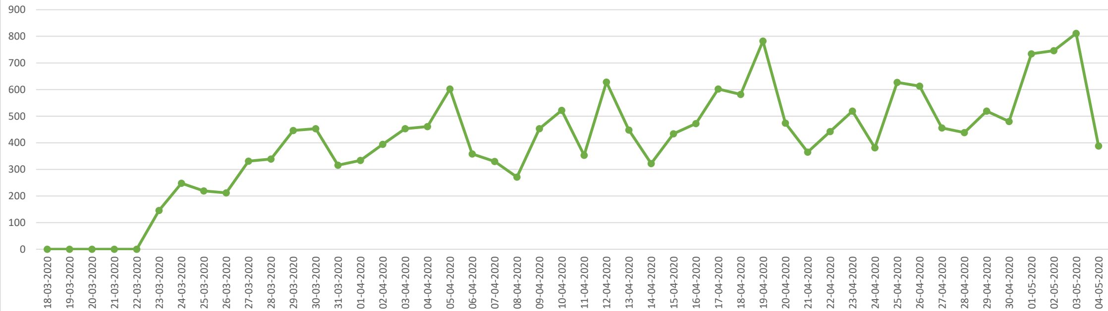
Quebrantamiento toque de queda